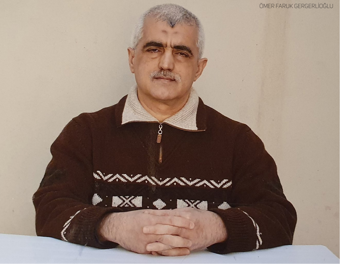
ÖMER FARUK GERGERLİOĞLU