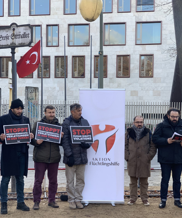
Öğretmen ve eğitimcilerin kaçırıldığı ülkelerdeki vatandaşlar, konsolosluklar önünde eylemler yaptılar.